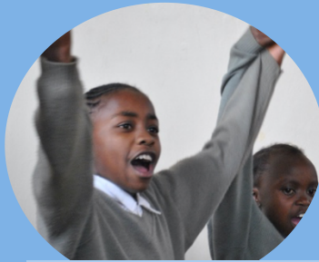
小学校8年生。元気いっぱい歌っています。