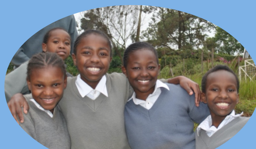
高校 1 年生。クラスメイトの女の子と一緒に。