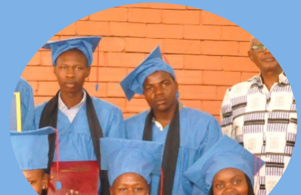
高校 3 年生の卒業式にて。コイノニア第一号の卒業生です。