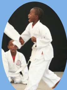
小学校2年生。このころから空手が大好きでした。

私の夢は、幼稚園の教師資格を取得後、スポーツトレーナーとして子どもたちを教えることです。そして自分の人生も、兄弟の生活も、より良いものにしていきたいです。空手も含めて、コイノニアで習ったことがこれからの私の人生を支えてくれると信じています。