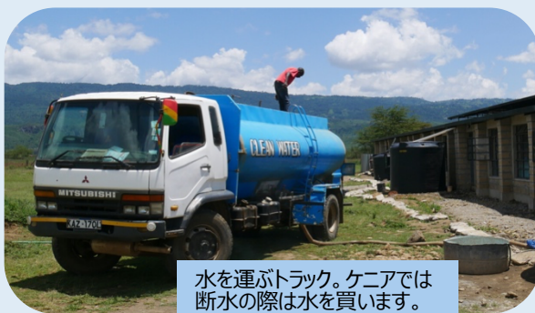
水を運ぶトラック。ケニアでは断水の際は水を買います。

皆様からのあたたかいご支援のおかげで、コロナ禍にあってもコイノニアの教育活動が豊かに行われています。大変な状況の中でコイノニアのことを覚えてくださり、ありがとうございます。皆様のご健康と毎日の暮らしが守られますよう、心よりお祈り申し上げます。